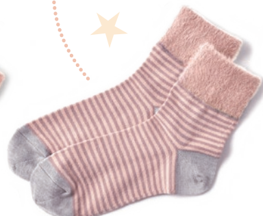
3 ピンク×ダルピンク