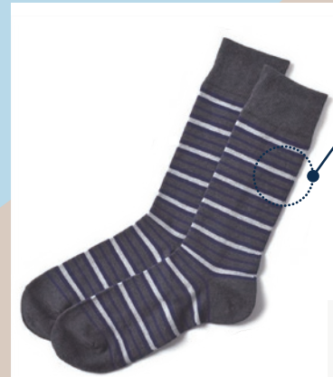
3 ネイビーボーダー