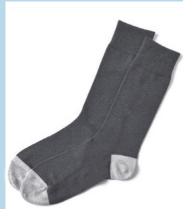
2 チャコールグレー