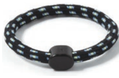
1 ブラックイエロー