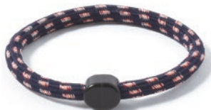
2 ネイビーオレンジ