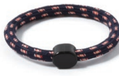
2 ネイビーオレンジ