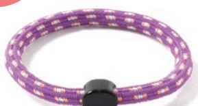
4 パープルサックス