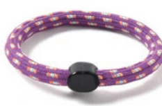
4 パープルサックス