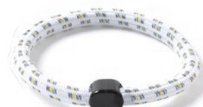
6 ホワイトイエロー