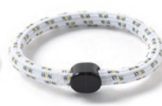
6 ホワイトイエロー