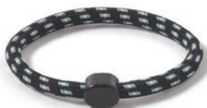
1 ブラックイエロー

本体サイズ 手首まわり約17.5cm パッケージサイズ W95×D27×H95mm (ヘッダー除く) 材質 ナイロン、ラバー、ステンレス糸、EVA樹脂 生産国 日本