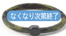
1 カモフラグリーン

本体サイズ 手首まわり約 17.5 cm パッケージサイズ W95xD27xH95mm (ヘッダー除く) 材質 ナイロン、ポリエステル、ステンレス糸、ポリウレタン、EVA樹脂 生産国 日本